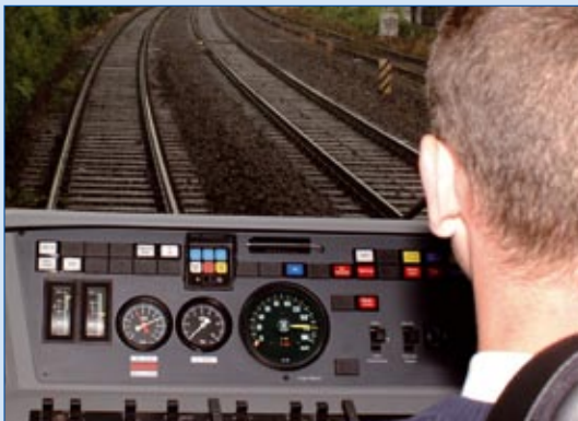
Fabrikneue Fahrzeuge für mehr Fahrplansicherheit