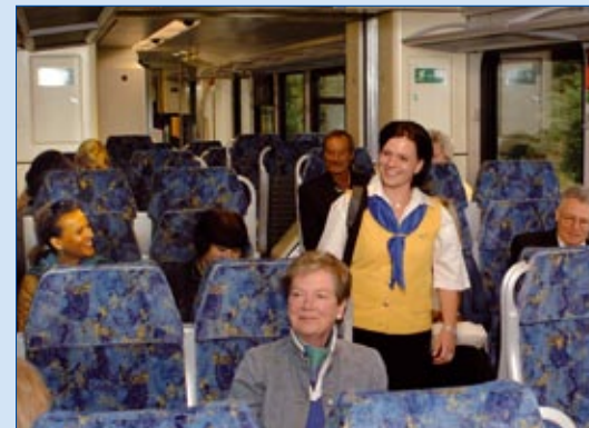
Freundliches Servicepersonal, angenehmes Reisen