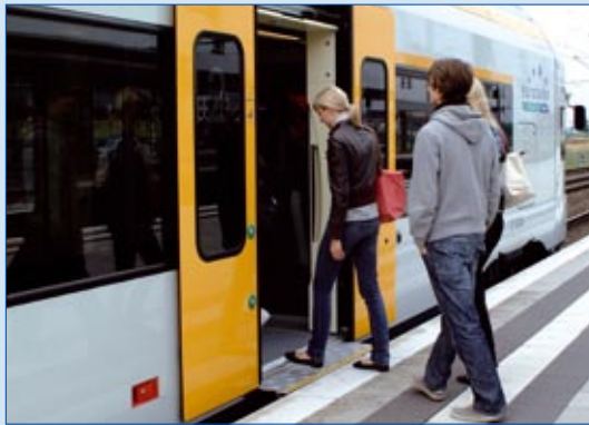
Ein- und Aussteigen mit automatischer Spaltüberbrückung