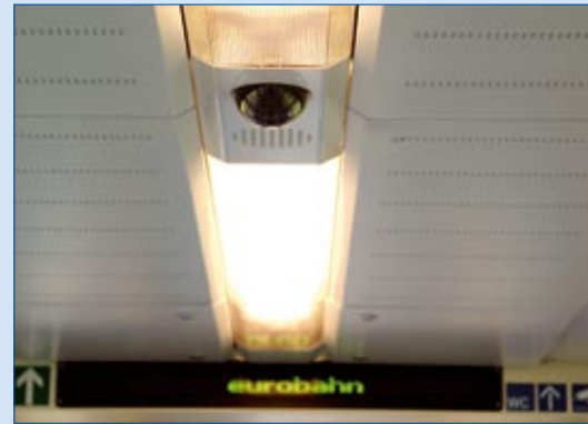
Videoüberwachung im gesamten Zug