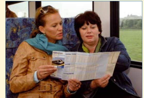
Die gewohnten Fahrzeiten bleiben erhalten