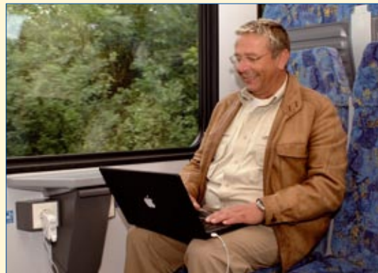
Steckdosen auch in der 2. Klasse für Handy, Laptop & Co