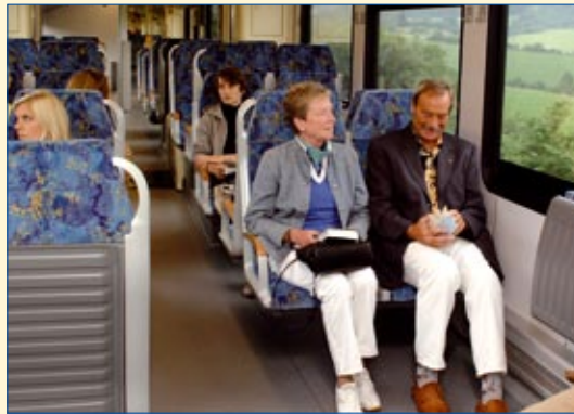
Im FLIRT: breite Sitze mit großer Beinfreiheit